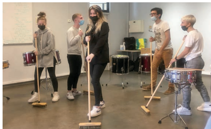
Les élèves ont joué à l'« apprenti sorcier » sur la musique de Paul Dukas en référence à Fantasia de Walt Disney.