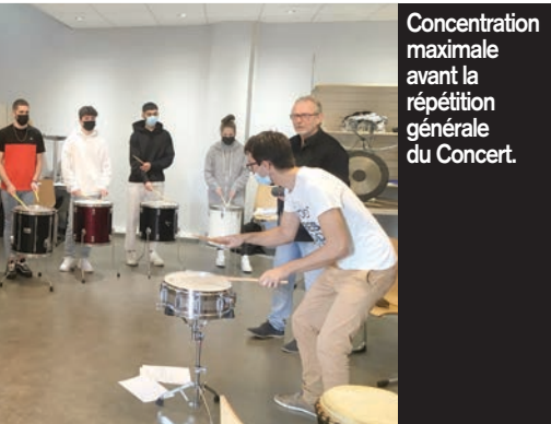
Concentration maximale avant la répétition générale du Concert.

de bois ou de baguettes, les jeunes apprentis ont fait sonner bidons, djembés, ou petites percussions : wood-bloc, cymbales suspendues, triangle, tambour de basque... « Ils jouent une sorte de jingle entre les interventions de l'Orchestre de Cannes ou accompagnent les interventions musicales de l'Orchestre, alternativement ou ensemble, en fonction de la musique. »